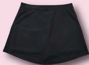
インナーパンツ付き