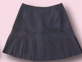
インナーパンツ付き