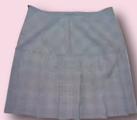
インナーパンツ付き