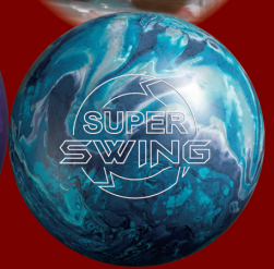
4位 スーパースウィング