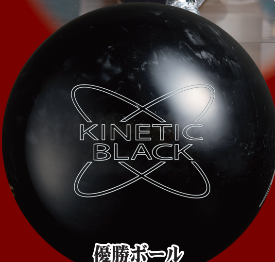
優勝ボール キネティックブラック