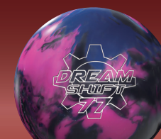
DREAM SHIFT 77