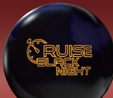
CRUISE BLACK NIGHT