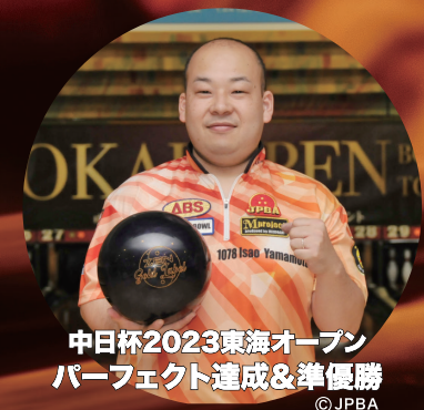
中日杯2023東海オープン パーフェクト達成&準優勝