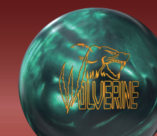
WOLVERINE DARK MOSS