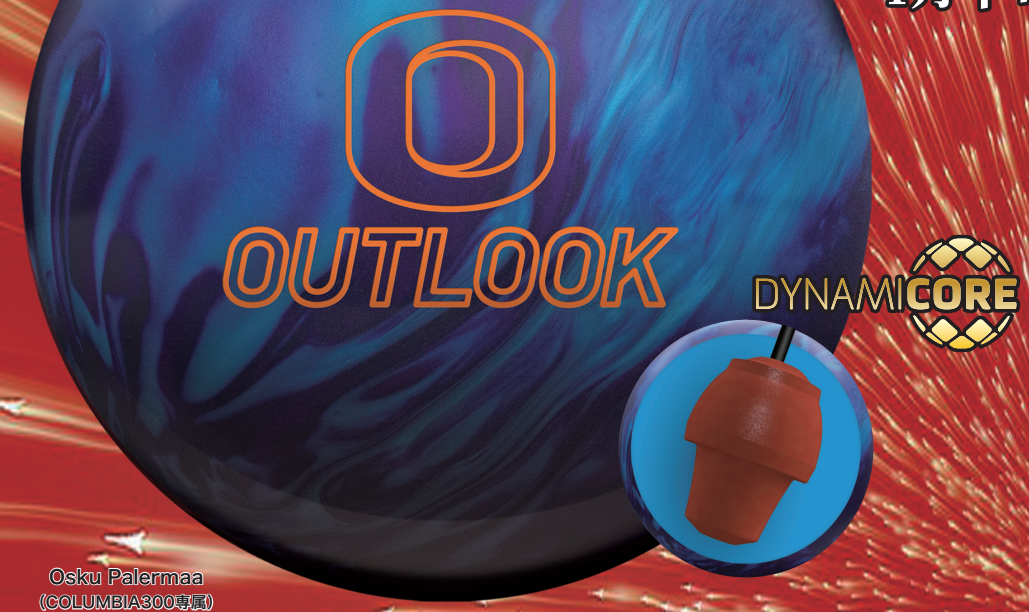
Osku Palermaa (COLUMBIA300専属)

HPの価格帯で使用されたカバーにBWの添加剤を融合させた為 ドライゾーンでの反応が非常に良い。またスキッドフリップ系の コアを搭載している為ハッキリとしたリアクションに加え ダイナミコアで高い反発力のあるピンアクションが得られます。