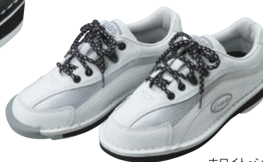
ホワイト・シルバー 22.0 - 28.0 cm