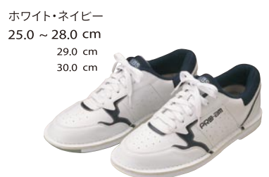
ホワイト・ネイビー 25.0 ~ 28.0 cm 29.0 cm 30.0 cm