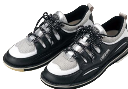
ブラック・シルバー 22.0 - 28.5 cm

価格 4,830円 本体4,600円 材質 PU合革、エナメルPU、PVC、EVA、フェルト、ラバー