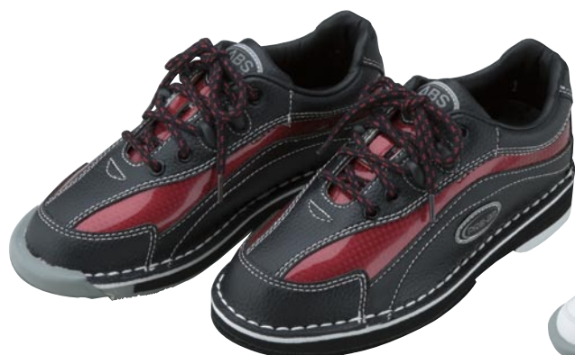
ワイン・ブラック 22.0 - 24.5 cm