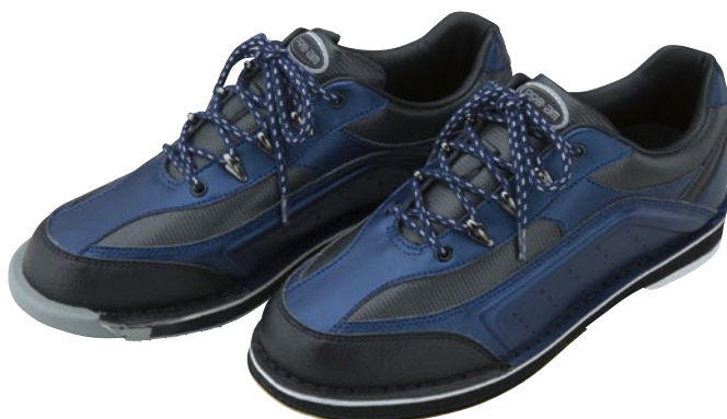
ネイビー・ブラック 24.5 - 28.0 cm

価格 9,135円 本体8,700円 材質 エンボPU、パールPU、EVA、ラバー、マジックテープ 付属品 スライドベースパーツ、スライドヒールパーツ、シューズ袋