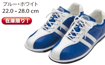
ブルー・ホワイト 22.0 - 28.0 cm 在庫限り!