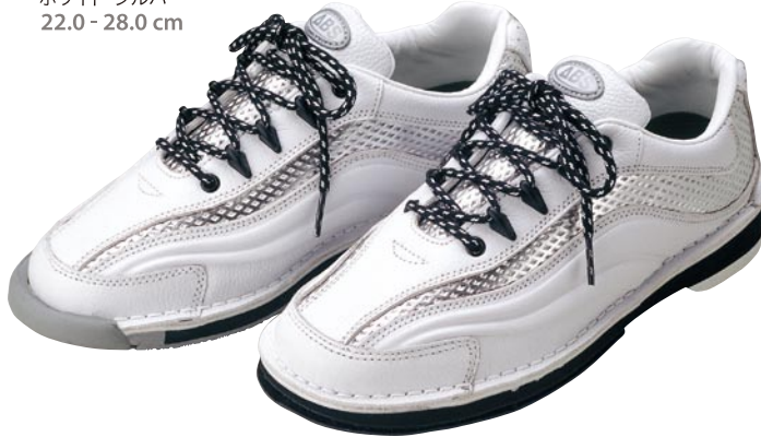
ホワイト・シルバー 22.0 - 28.0 cm

※ブラック・ブラックのみ。28.0~30.0cmは1cm刻みです。28.5、29.5cmはありません。