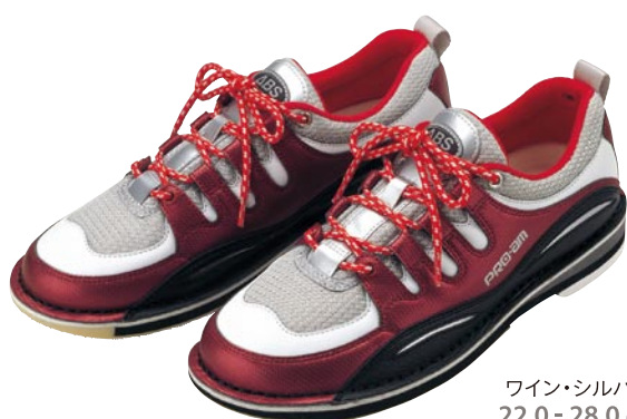
ワイン・シルバー 22.0 - 28.0 cm

価格 5,985円 本体5,700円 材質 PU合革、PUミッドソール、フェルト、ラバー