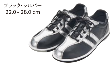
ブラック・シルバー 22.0 - 28.0 cm