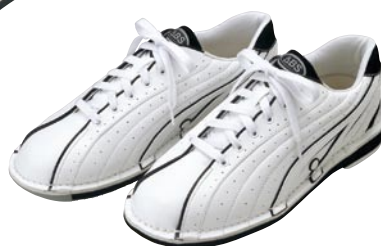
ホワイト・ブラック 24.5 - 28.0 cm