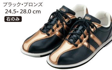
ブラック・ブロンズ 24.5 - 28.0 cm 右のみ