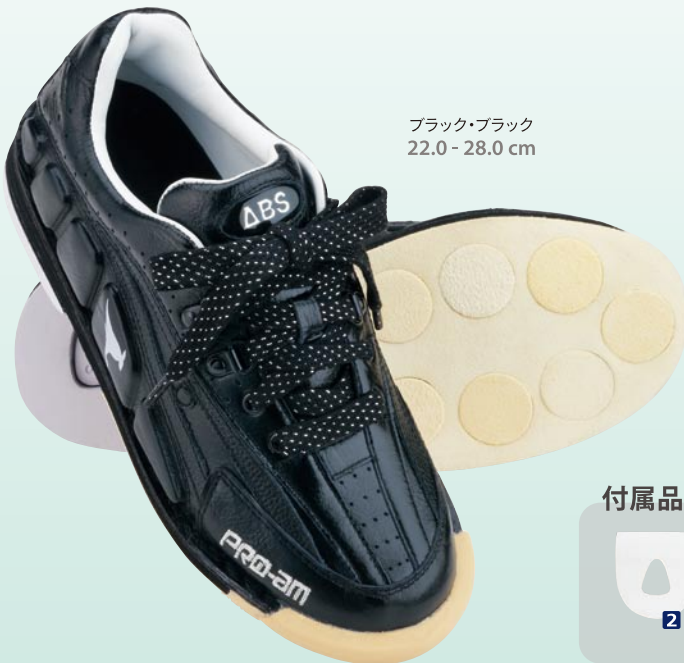
ブラック・ブラック 22.0 - 28.0 cm

スライドベースパーツ(クリーツ仕様)、スライドクリーツパーツ、スライドヒールパーツ、木製シューキーパー、クリーツホーン、靴べら、シューズカバー、シューズ袋