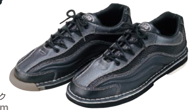
ブラック・ブラック 22.0 - 30.0 cm 28.5と29.5はありません