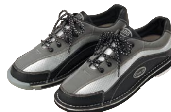
シルバー・ブラック 24.5 - 28.0 cm

価格 7,140円 本体6,800円 材質 エンボPVC、PVC、エナメルPU、EVA、ラバー、マジックテープ 付属品 スライドベースパーツ、スライドヒールパーツ、シューズ袋