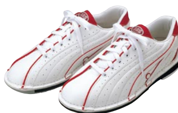
ホワイト・レッド 22.0 - 24.5 cm