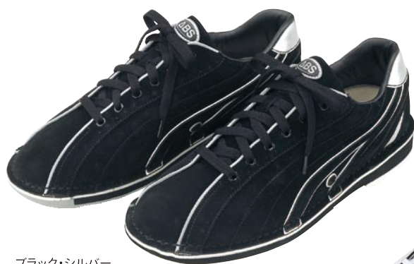
ブラック・シルバー 24.5 - 28.0 cm