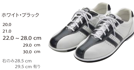
ホワイト・ブラック 20.0 21.0 22.0 ~ 28.0 cm 29.0 cm 30.0 cm 右のみ28.5 cm 29.5 cm 有り