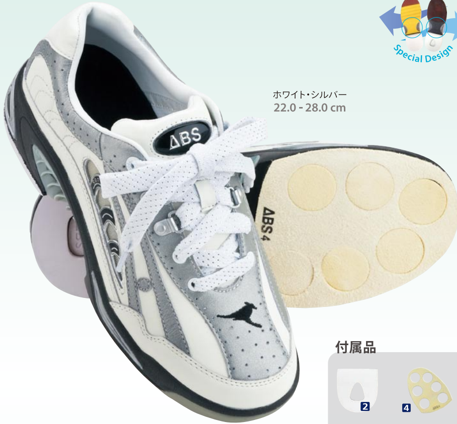
ホワイト・シルバー 22.0 - 28.0 cm