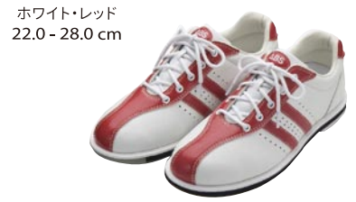
ホワイト・レッド 22.0 - 28.0 cm