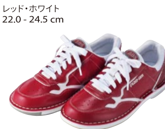
レッド・ホワイト 22.0 - 24.5 cm