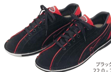
ブラック・レッド 22.0 - 28.0 cm