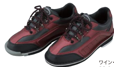
ワイン・ブラック 22.0 - 24.5 cm