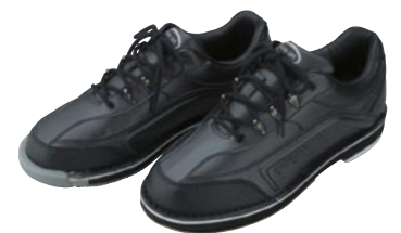
ブラック・ブラック 24.5 - 28.0 cm ※右のみ 31.0 cm有り