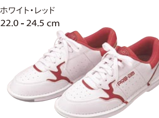
ホワイト・レッド 22.0 - 24.5 cm