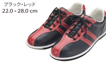
ブラック・レッド 22.0 - 28.0 cm