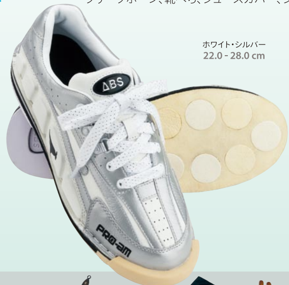
ホワイト・シルバー 22.0 - 28.0 cm