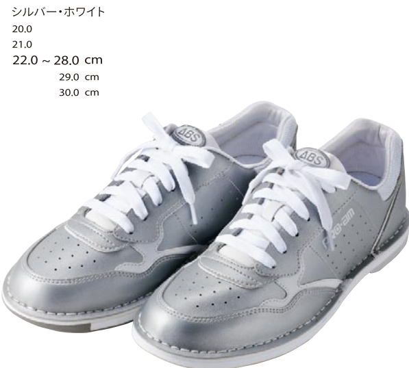
シルバー・ホワイト 20.0 21.0 22.0 ~ 28.0 cm 29.0 cm 30.0 cm