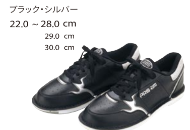
ブラック・シルバー 22.0 ~ 28.0 cm 29.0 cm 30.0 cm