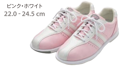
ピンク・ホワイト 22.0 - 24.5 cm