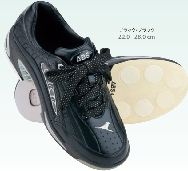
ブラック・ブラック 22.0 - 28.0 cm