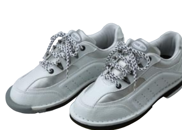
ホワイト・ホワイト 22.0 - 28.0 cm ※右のみ 20.0 cm 21.0 cm有り