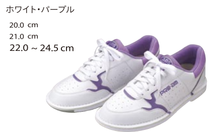
ホワイト・パープル 20.0 cm 21.0 cm 22.0 ~ 24.5 cm