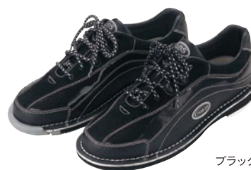
ブラック・ブラック 22.0 - 28.0 cm