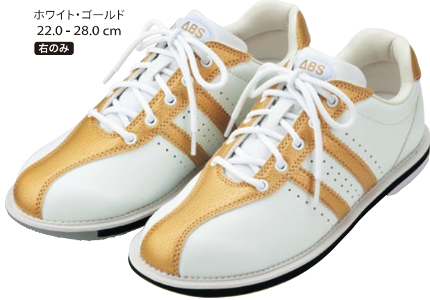
ホワイト・ゴールド 22.0 - 28.0 cm 右のみ