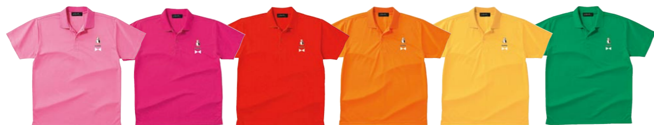
011 PINK 146 HOT PINK 010 RED 015 ORANGE 165 DAISY 025 GREEN