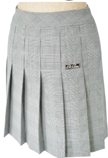
1 GLEN CHECK