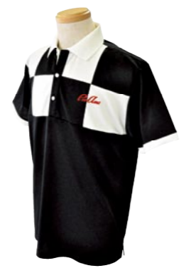
1 BLACK / WHITE