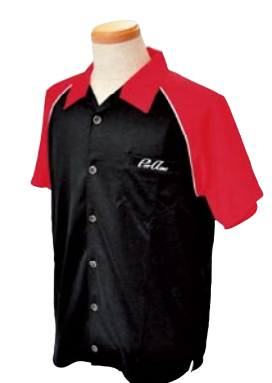
1 BLACK / RED