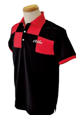
2 BLACK / RED