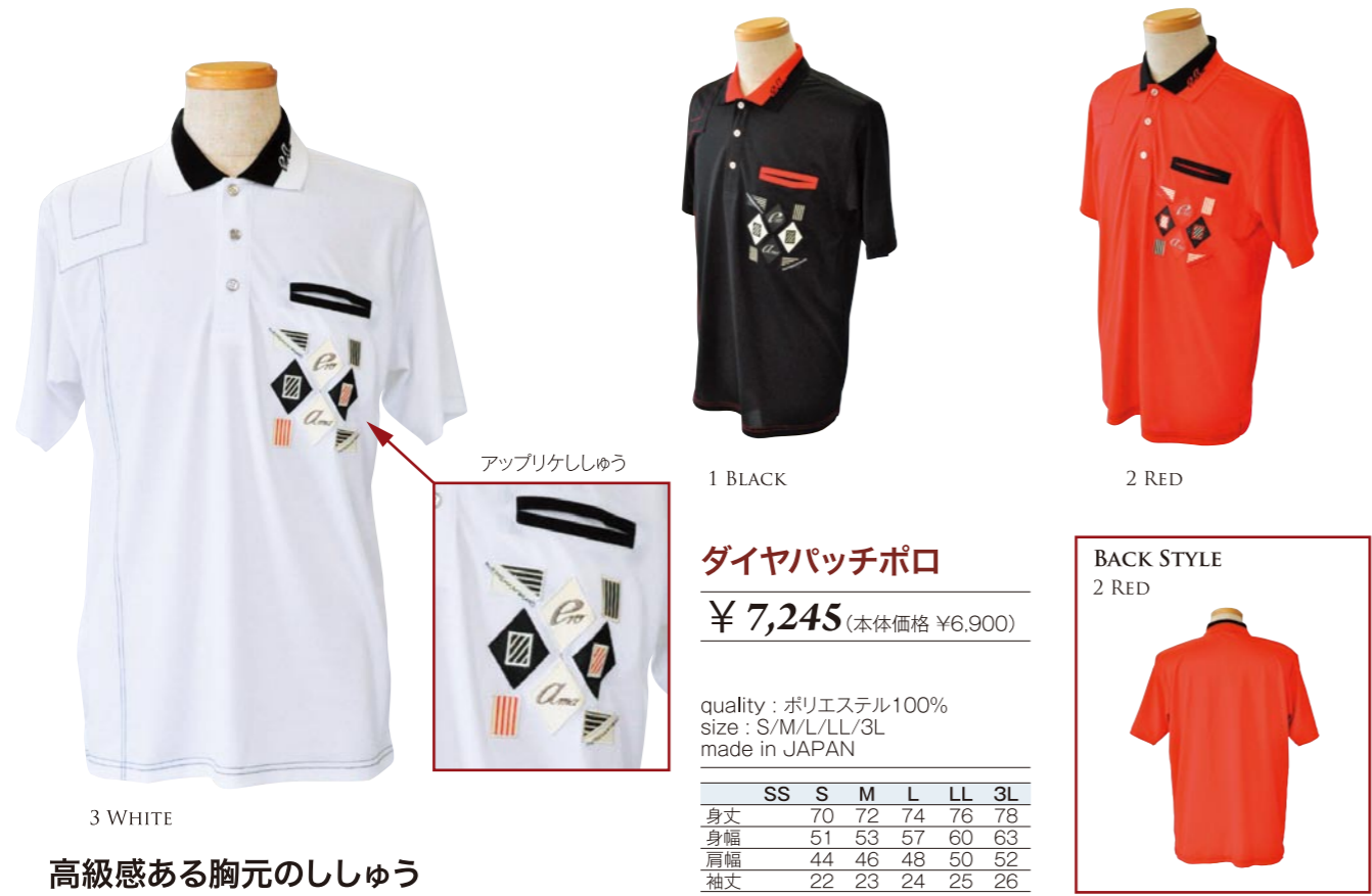
3 WHITE 高級感ある胸元のししゅう

1 BLACK 2 RED ダイヤパッチポロ ¥ 7,245 (本体価格 ¥6,900) quality : ポリエステル100% size : S/M/L/LL/3L made in JAPAN SS S M L LL 3L 身丈 70 72 74 76 78 身幅 51 53 57 60 63 肩幅 44 46 48 50 52 袖丈 22 23 24 25 26