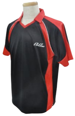
1 BLACK / RED