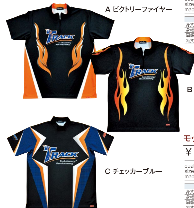
A ビクトリーファイヤー