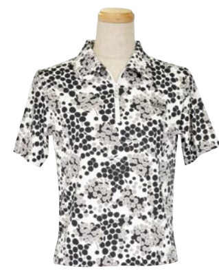
1 WHITE / BLACK