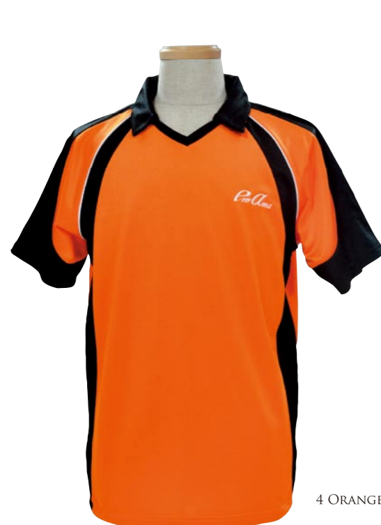
4 ORANGE / BLACK