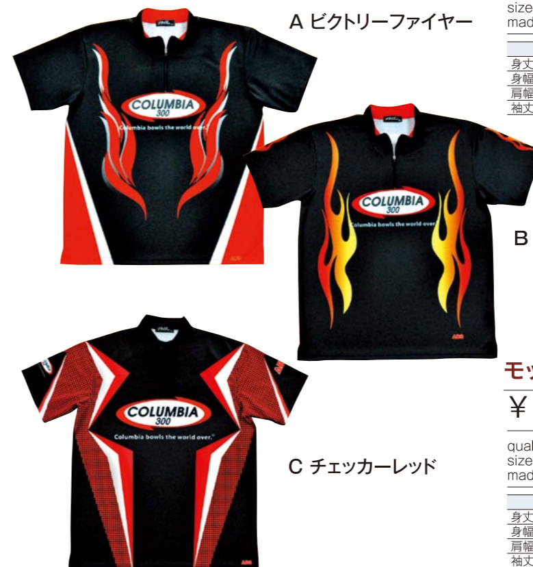
A ビクトリーファイヤー