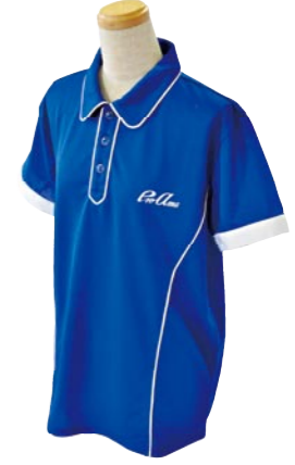
3 BLUE / WHITE