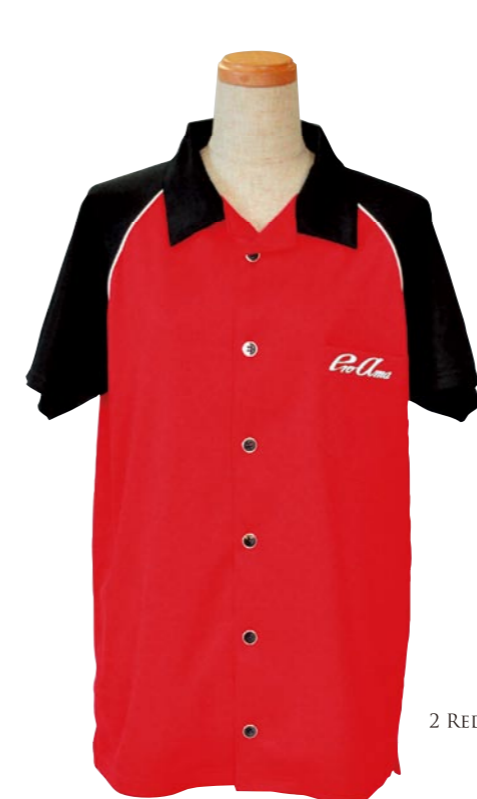
2 RED / BLACK