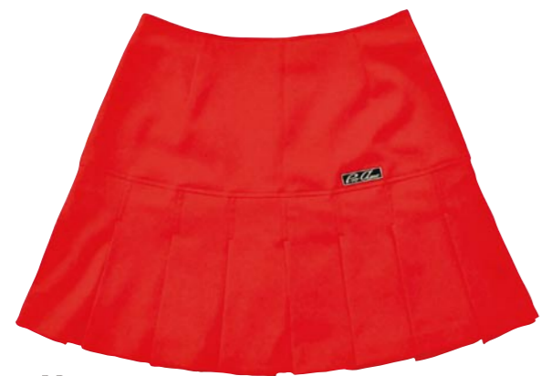
5 RED NEW COLOR