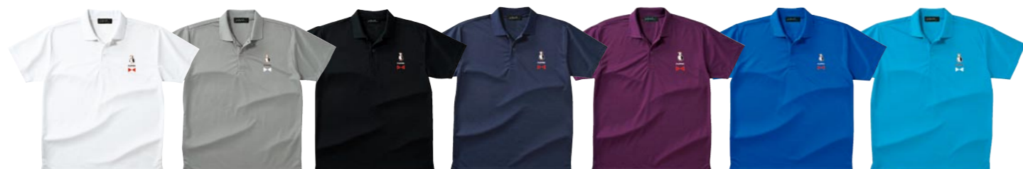
001 WHITE 002 GRAY 005 BLACK 031 NAVY 014 PURPLE 032 ROYAL BLUE 034 TURQUOISE BLUE