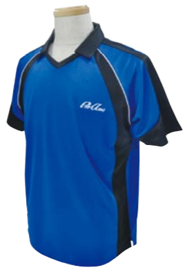
3 BLUE / BLACK