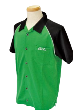
4 GREEN / BLACK