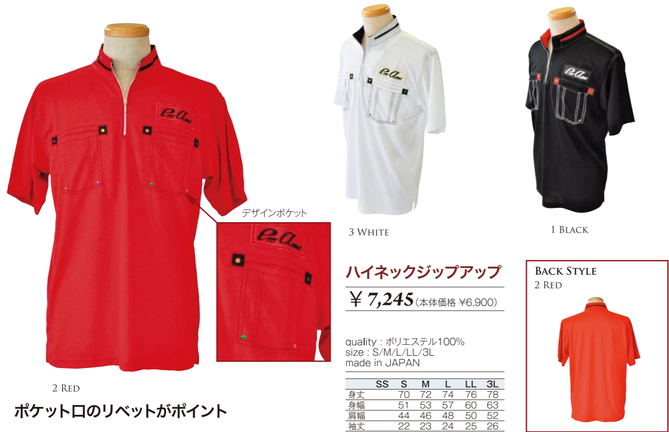
2 RED ポケット口のリベットがポイント

3 WHITE 1 BLACK ハイネックジップアップ ¥ 7,245 (本体価格 ¥6,900) quality : ポリエステル100% size : S/M/L/LL/3L made in JAPAN SS S M L LL 3L 身丈 70 72 74 76 78 身幅 51 53 57 60 63 肩幅 44 46 48 50 52 袖丈 22 23 24 25 26