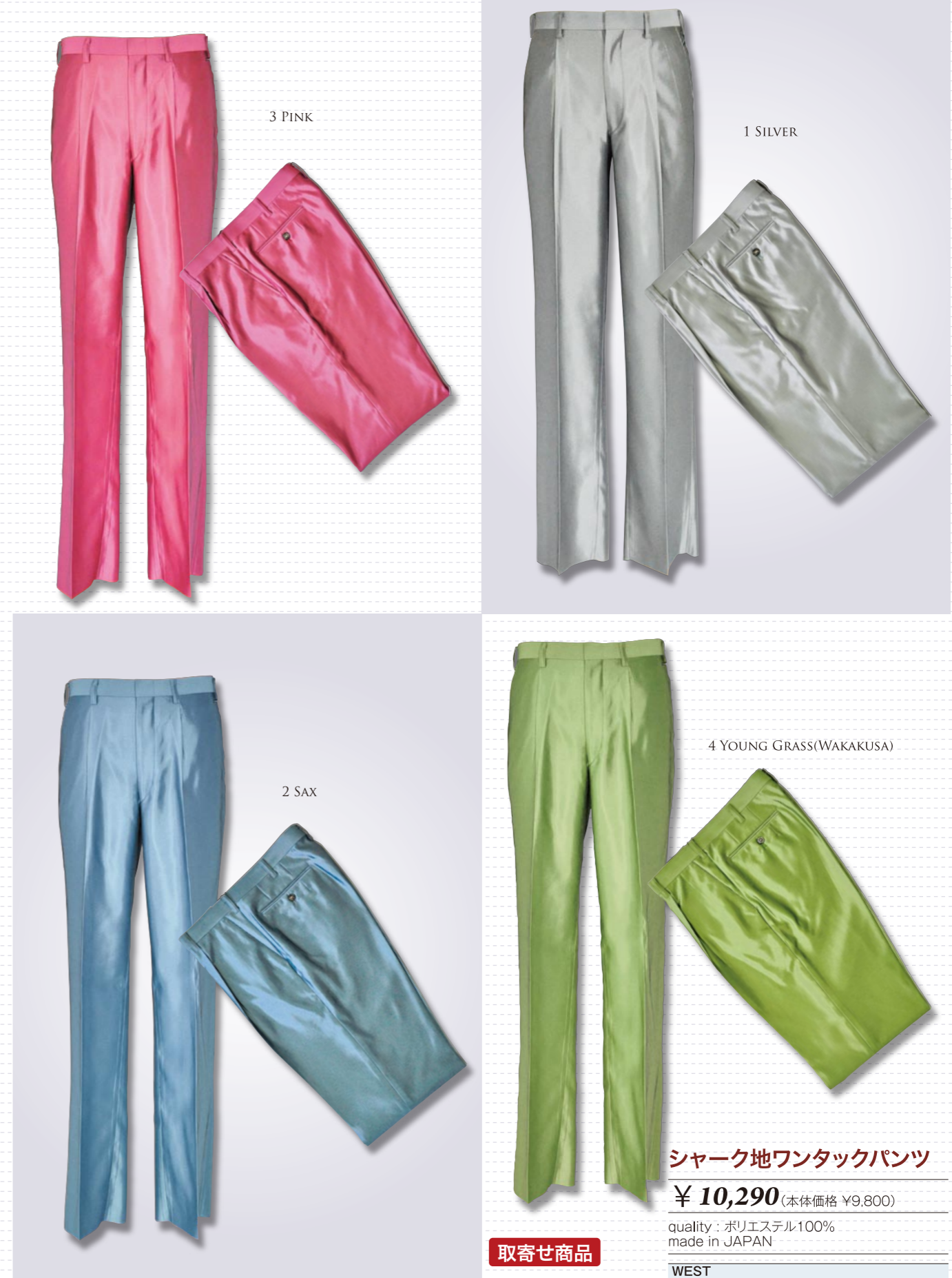
光沢ある新しい素材を使用