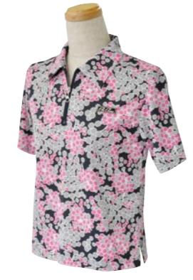
2 NAVY / PINK