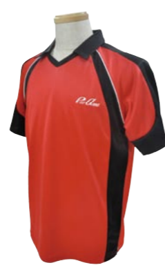
2 RED / BLACK