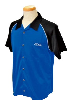
3 BLUE / BLACK