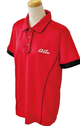
2 RED / BLACK