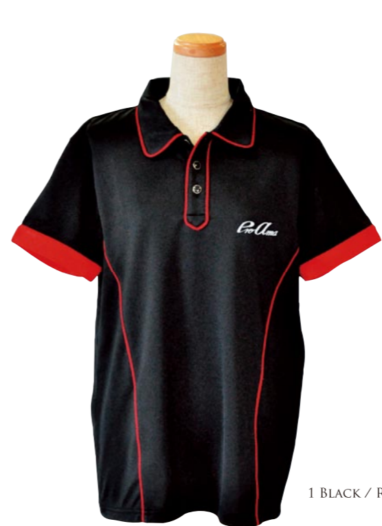
1 BLACK / RED