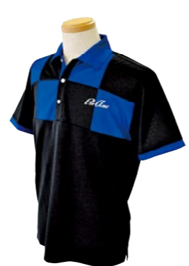
4 BLACK / BLUE