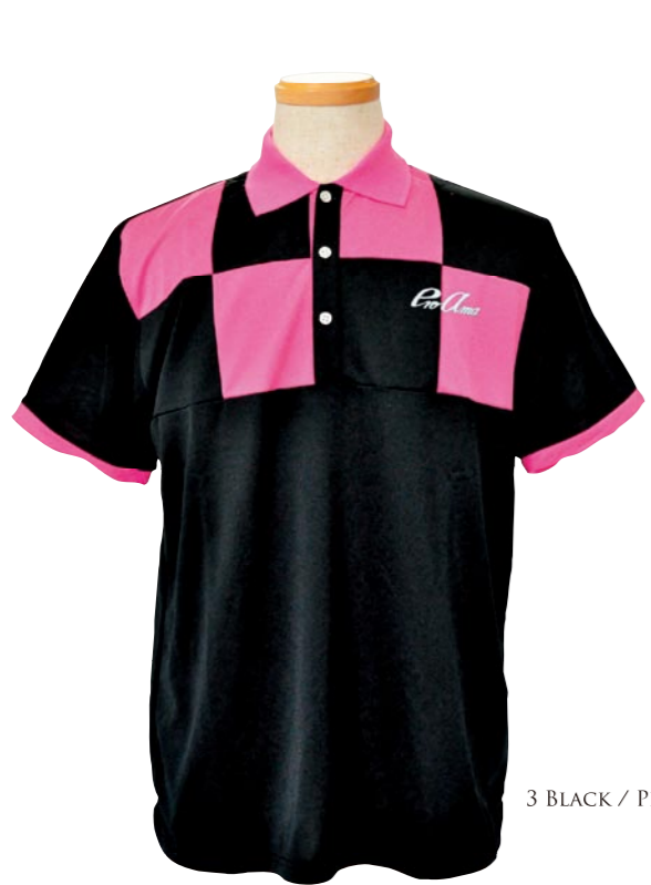
3 BLACK / PINK