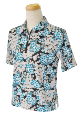
3 BLACK / GREEN