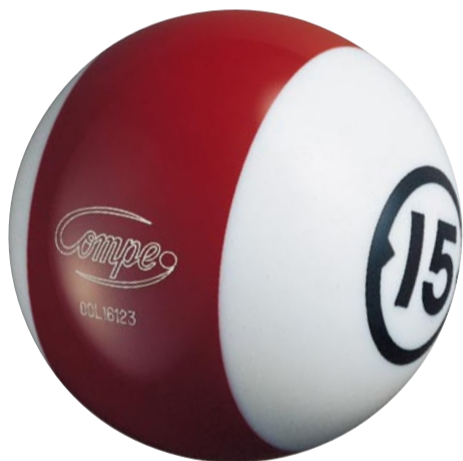
15 lbs ダークレッド