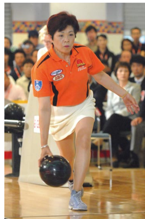
斉藤志乃ぶプロ ギネス記録保持者。74勝の女王