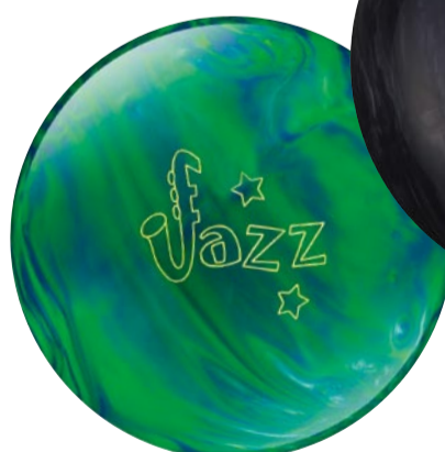
グリーン・ブルー 15lbのみ