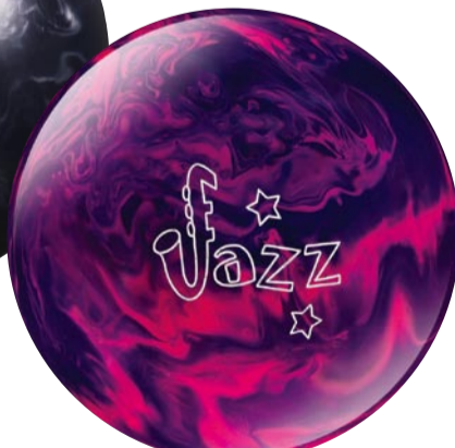
パープル・ピンク 15lbのみ