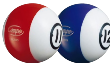
11 lbs レッド