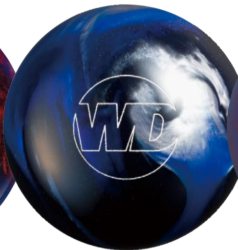
ブルー×ブラック×シルバー NEW