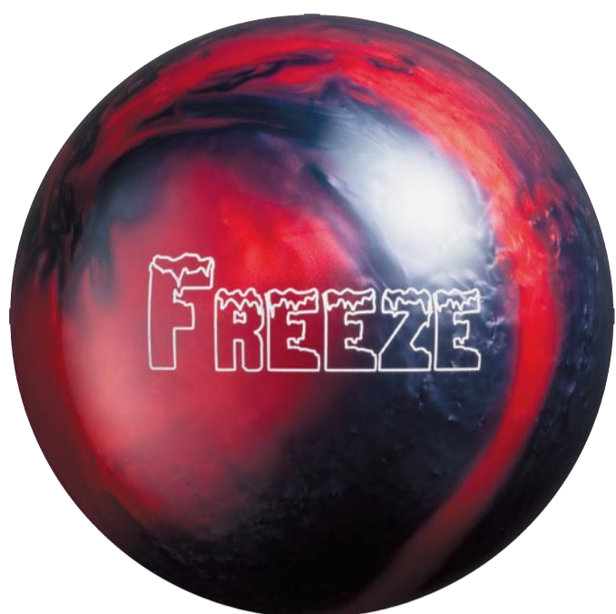
スカーレット×ブラック