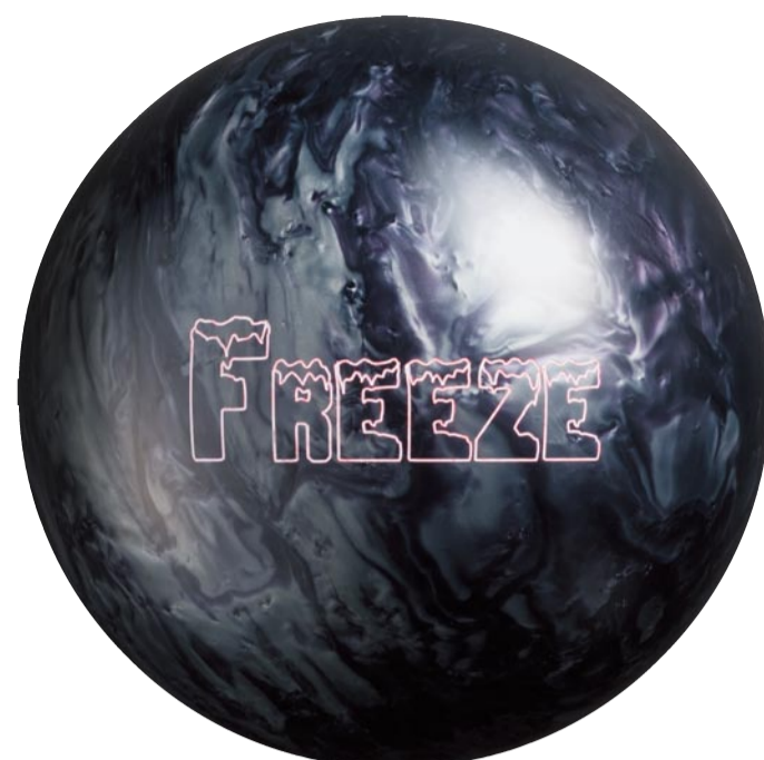
ブラック×シルバー