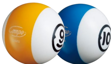
9 lbs イエロー