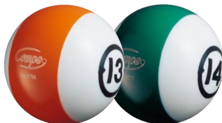
13 lbs オレンジ