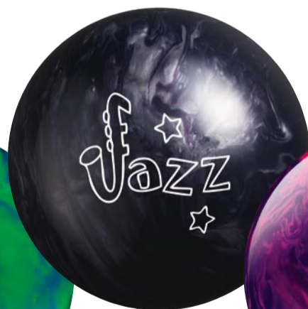
ブラック・パール 11lbのみ