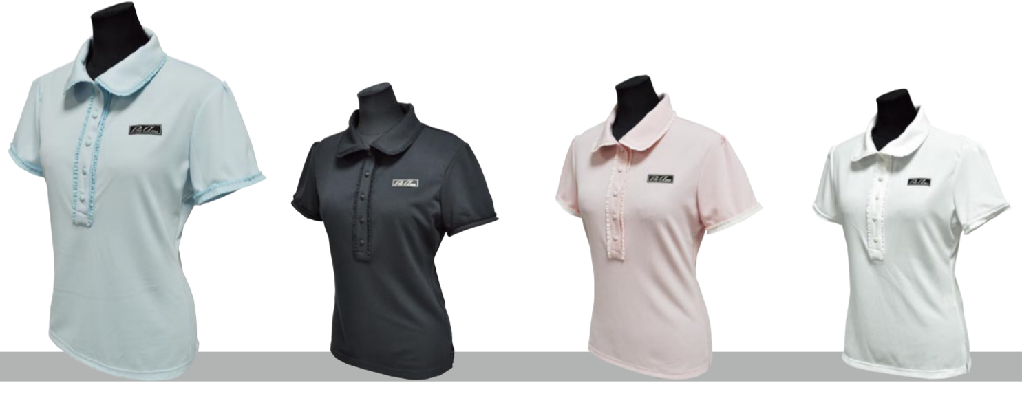
4 ライトブルー 1 ブラック 3 ライトピンク 2 ホワイト