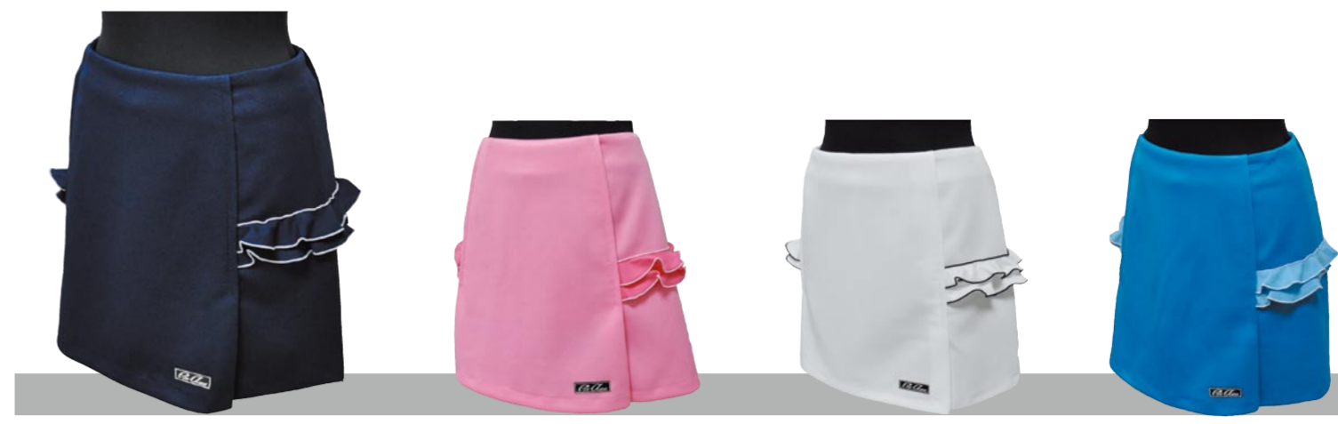
2 ネイビー 3 ピンク 1 ホワイト 4 サックス