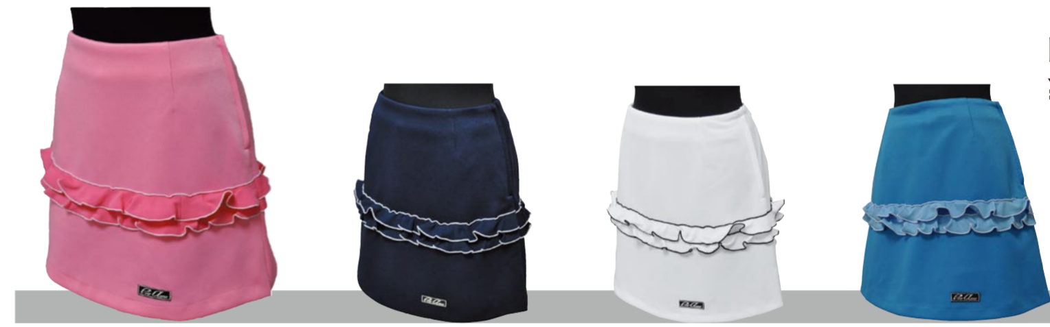
3 ピンク 2 ネイビー 1 ホワイト 4 サックス