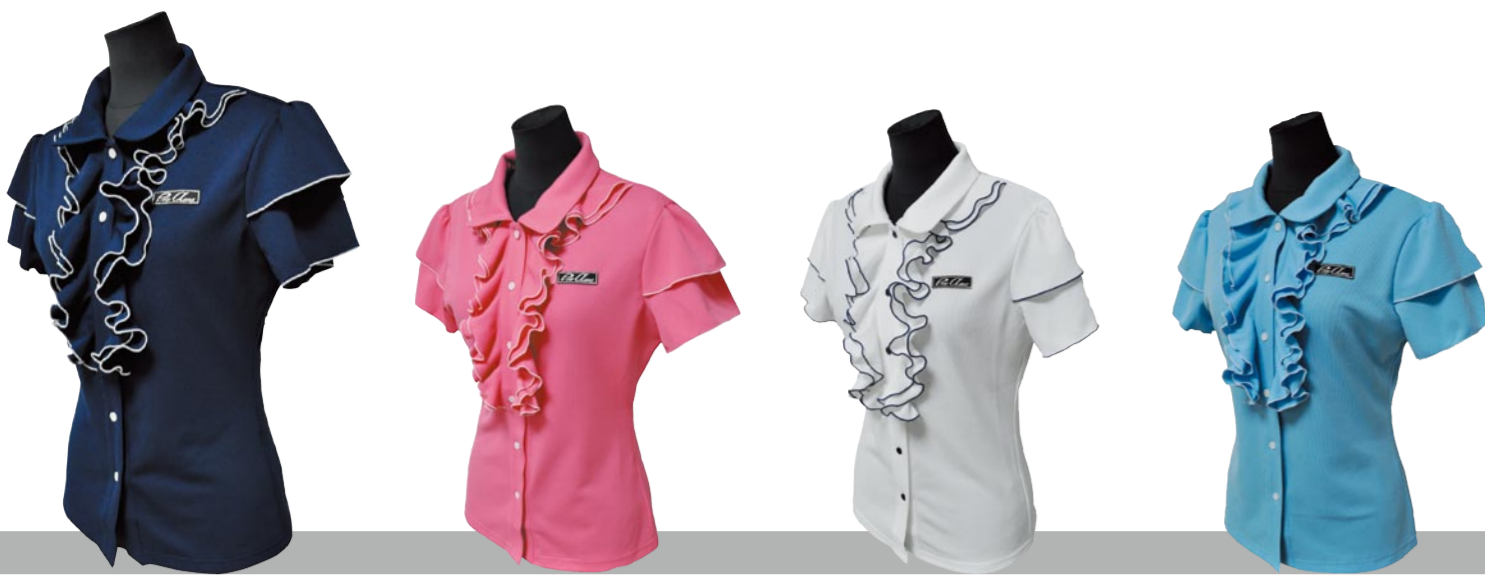
2 ネイビー / ホワイト 3 ピンク / ホワイト 1 ホワイト / ネイビー 4 サックス / ホワイト