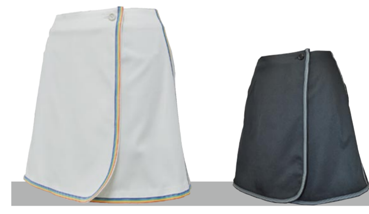
2 ホワイト 1 ブラック