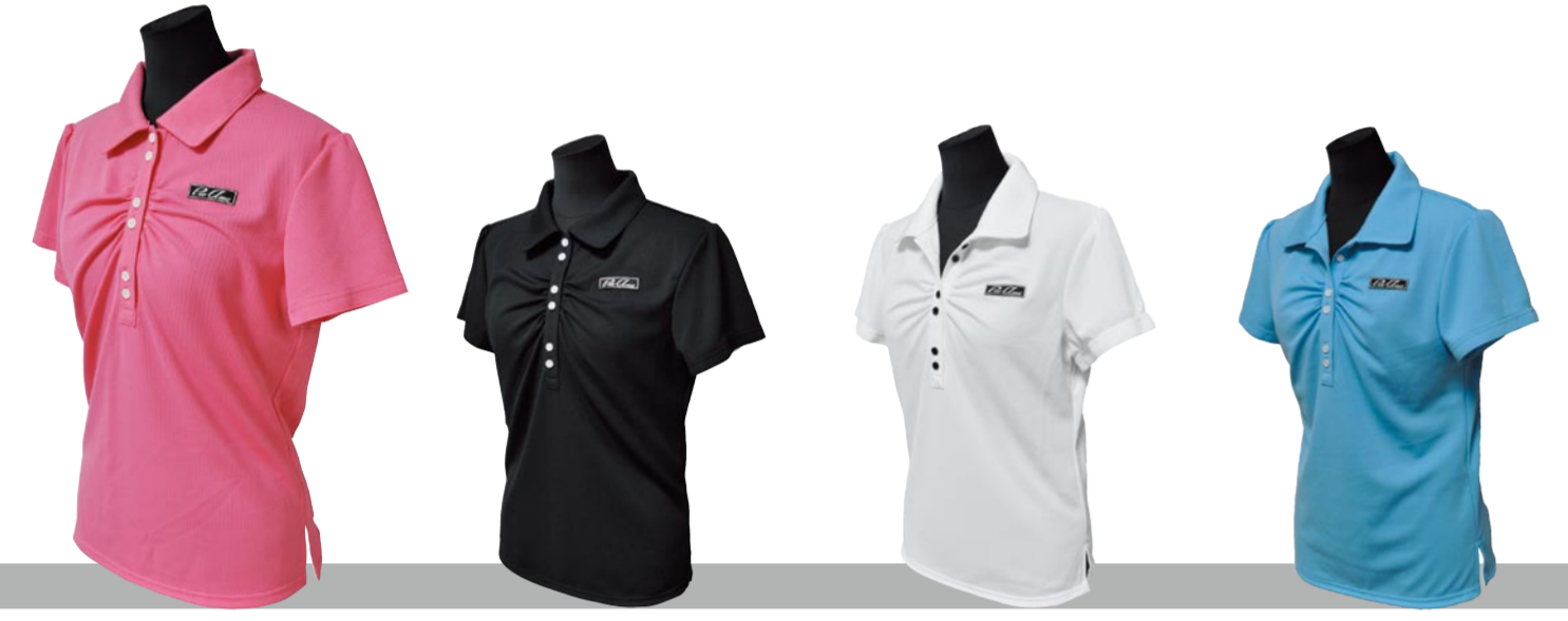
3 ピンク 2 ブラック 1 ホワイト 4 サックス