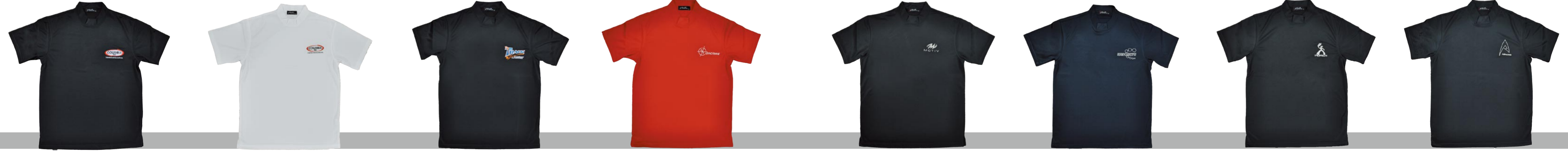
コロンビア ブラック コロンビア ホワイト トラック ブラック ダイノタン レッド モーティブ ブラック ナノデス ブラック モーリッチ ブラック アブソリューション ブラック