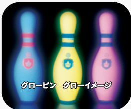
ウィンサム製カラフルグローピン グローピン グローイメージ 納入単位 10本 カラー ホワイト、イエロー、レッド