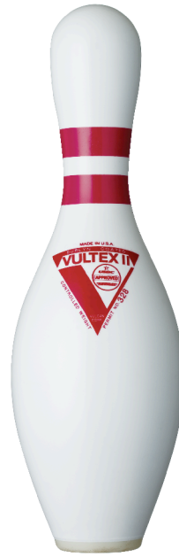
バルテックスII バルカン製ピン バルテックス II 納入単位 10本 認可番号 USBC Permit No. 328 JBC Permit No. 30