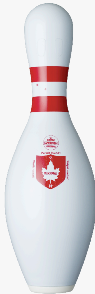
ウィンサムホワイト