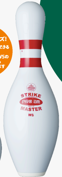
ストライクマスター-WS

通常の1/2サイズ! イベント企画で使用できる かわいらしい ストライクマスター-WSの ミニチュアピンも お取扱いしております