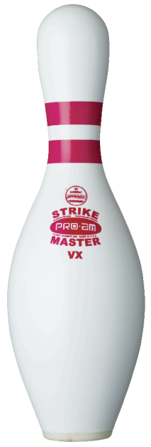
ストライクマスター-VX バルカン製ストライクマスター ストライクマスター-VX 納入単位 10本 認可番号 USBC Permit No. 399 JBC Permit No. 50