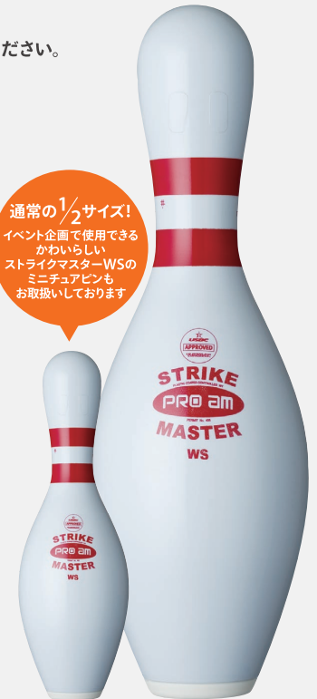
ミニチュアピン ストライクマスターWS

通常の1/2サイズ! イベント企画で使用できる かわいらしい ストライクマスターWSの ミニチュアピンも お取扱いしております