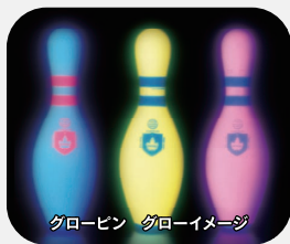
グローピン グローイメージ