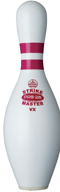
ストライクマスターVX