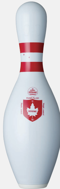
ウィンサムホワイト