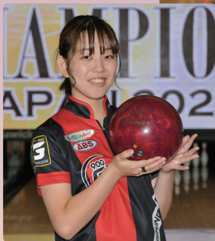
NANODESU Accu Drive II