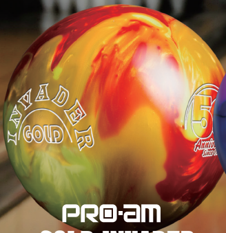
PRO-AM GOLD INVADER