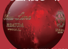
Accu-Line PREMIUM SPECIAL