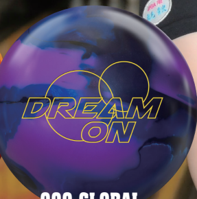
900 GLOBAL DREAM ON (予選使用ボール)