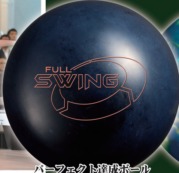
パーフェクト達成ボール フルスウィング