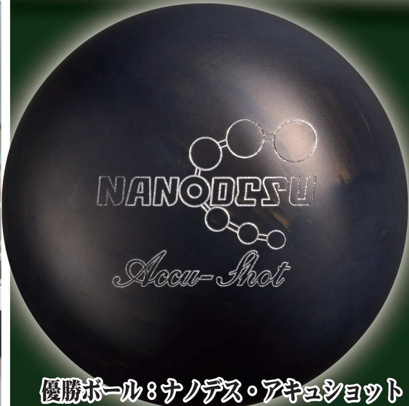
優勝ボール：ナノデス・アキュショット