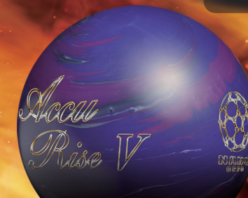
Accu Rise V