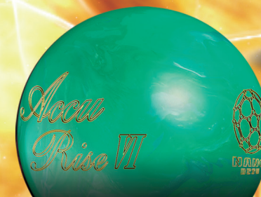
Accu Rise VI