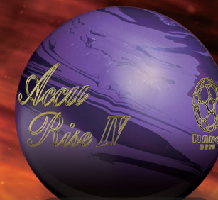
Accu Rise IV