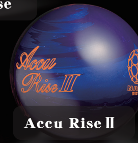
Accu Rise II