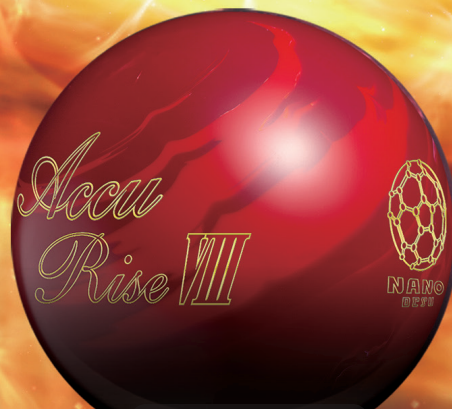
Accu Rise VIII