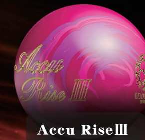
Accu Rise III