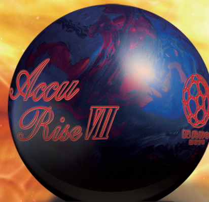
Accu Rise VII