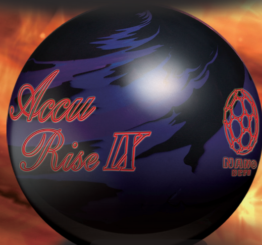
Accu Rise IX